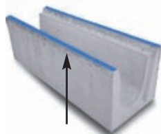
Canaletta c/ salvabordo