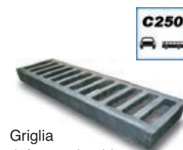
Griglia rinforzata in ghisa sferoidale